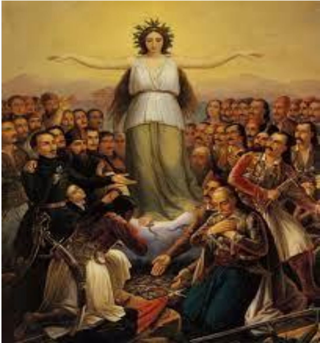
Θεόδωρος Βρυζάκης: Η Ελλάς ευγνωμονούσα