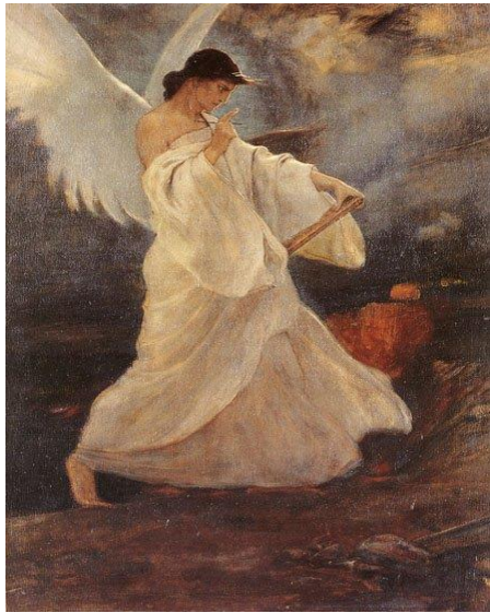
Ν.Γύζης, Η δόξα των Ψαρών

Με το έργο του αυτό, ο Γύζης συμπορεύεται με τον Σολωμό.