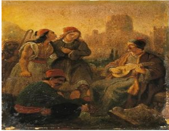
Peter-von-Hess, Ο Ρήγας Φεραίος ψάλλει το Θούριο

«Ως πότε παλικάρια να ζούμεν στα στενά μονάχοι σαν λιοντάρια στες ράχες, στα βουνά... Καλλιό 'ναι μιας ώρας ελεύθερη ζωή Παρά σαράντα χρόνια σκλαβιά και φυλακή!» (Θούριος)